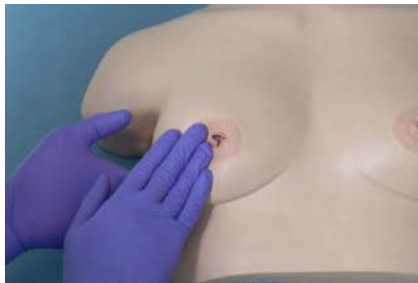
Figur 3.3: Benutzen Sie die flachen Finger, um die Brust in allen vier Quadranten zu betasten

Fragen Sie nach Schmerz oder Druckempfindlichkeit vor dem Ertasten der Patientin. Fragen Sie die Patientin, ob sie jeden Knoten bemerkt hat. Wenn ja, untersuchen Sie zuerst die andere Brust. Positionieren Sie die Patientin mit einer 45-Grad-Neigung an der Taille zurückgelehnt. Benutzen Sie die flachen Finger, um die Brust zu betasten ( Figur 3.3 )