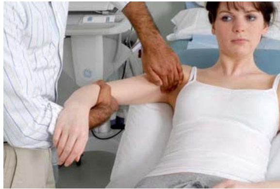
Fig. 3.5: Palpation der Achsel: vordere und seitliche Gruppe von Lymphknoten

Schwenken Sie um und untersuchen Sie die andere Brust und Achsel. Wenn Sie einen Knoten finden, beschreiben Sie: