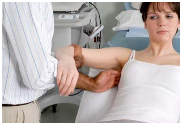
Fig. 3.4: Palpation der Achsel: mediale und hintere Gruppe von Lymphknoten